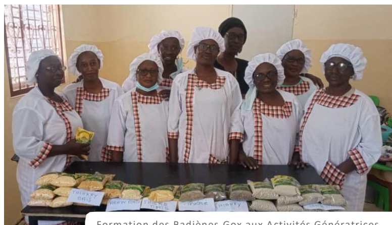
Formation des Badiènes Gox aux Activités Génératrices de Revenus, Rufisque